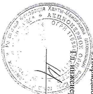
ГРАФИК ПРОВЕРКИ (ПРОЧИСТКИ) ВЕНТИЛЯЦИОННЫХ КАНАЛОВ МНОГОКАРТИРНЫХ ЖИЛЫХ ДОМОВ ОБОРУДОВАННЫХ СИСТЕМОЙ ГАЗОСНАБЖЕНИЯ НА 2024Г. ЖЭУ № 1